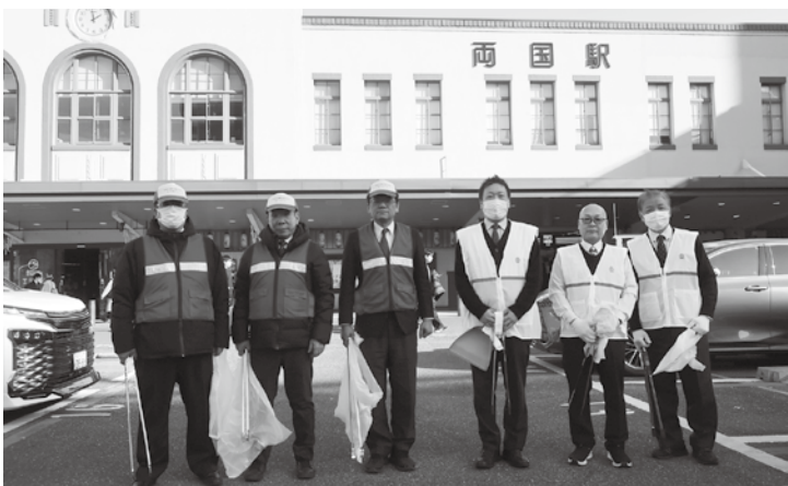
参加された皆さん

環境美化運動を行うことは、個人タクシーだから、タクシーだからということではなく、誰かが街をきれいに保ってくれているのだということを世の中全体に見せることに意味があるのだと思う。日本は観光立国として歩み始めたのだから、公共交通にかかわるものとして、われわれはこうした活動をこれからも継続して行っていくかなければならないと思う。